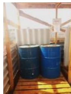
Foto 1 e 2 – Armazenamento de materiais impermeabilizantes